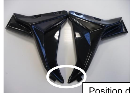
Position des Kantenschutzes